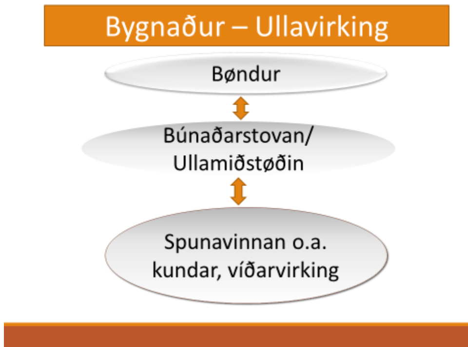
Mynd 1. Bygnaður og prinsippskitsa

Viðvíkjandi sjálvari innsavnanini verður støði tikið í sama leisti, sum verður skotin upp í frágreiðingini hjá Búnaðarstovuni frá juni 2010 "Innsavning, flokking og vasking av ull", fyriskipað av Olgu Biskopstø, verkætlanarleiðara, sí mynd 2 niðanfyri.